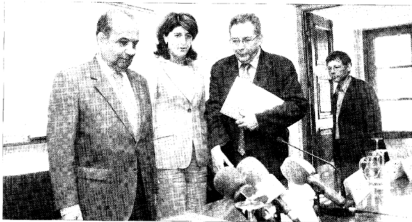
El rector de la UNIA (izquierda), acompañado de los responsables de las jornadas sobre paisaje que ayer se inauguraron en la sede iberamericana.